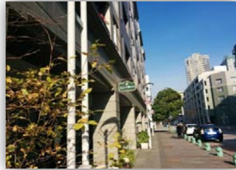
プロムナード沿いはとても便利