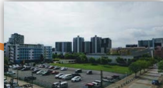
リビングからみる広がりのある景色